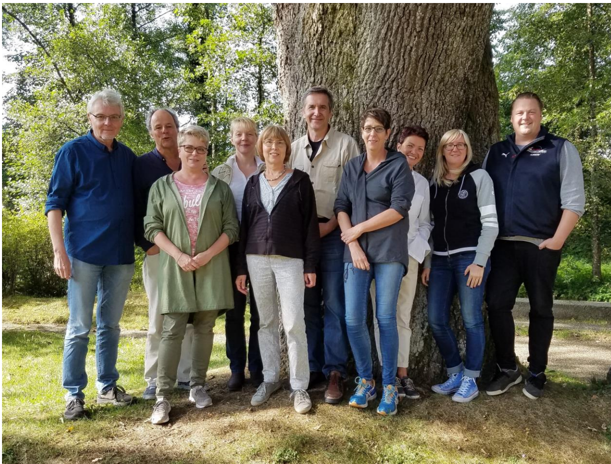
Teilnehmer und Trainer, Seminar 2018

Teilnehmer/innen, die trotz Anmeldung nicht erschienen sind, wird die Gebühr nur in Ausnahmefällen zurückerstattet. Generell gilt: Eine Erstattung ist nur möglich bei Krankheit oder bei Absage bis spätestens 14 Tage vor dem Termin.